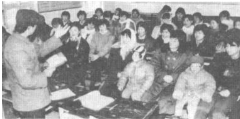
垦利县下镇乡妇联、采取各种形式对农村妇女进行实用技术培训。去年一年中，共举办各类培训班16期，培训妇女600多人。图为养鸡技术班正在上课。

吴厂长就是靠这“三把火”，把全厂干部职工烤得心里热乎乎的。这三把火，激发了全厂职工的热情。1991年实现产值250.2万元，比前年增长30.3%。实现利润15.5万元，实现利税30.4万元，比前年增长192.3%。并为全厂职工补发了上年拖欠的全部奖金。吴厂长自信地说：今年我们将新上6台设备，改造大车间，开发新产品，培养技术后备力量，把我们机械厂搞得更红火，更兴旺。（朱希凤 董安荣 连秀英）