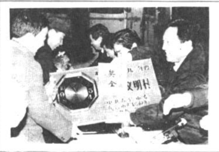
会议对全市40个农业和农村工作先进单位进行了表彰。图为市领导为先进单位颁奖。

市化工厂娱乐活动丰富 本报讯 元宵节前夕，市化工厂举办文艺晚会、舞会等丰富多彩的娱乐活动。厂里投资近万元，装饰、修整了活动场所，购买了文体用品。新铺