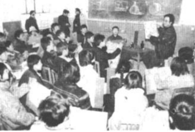
市师范学校寒假期间举办了第三期音美培训班。来自市和油田的250名学员在这里接受专业指导。图为美术辅导教师给学员讲素描描法。

去年“六一”前夕，这个大队组织开展了“为敬老院老人献爱心”活动。队员们捐出自己平时节省下来的零花钱300多元，为乡敬老院的老人每人买了一台收音机。“六一”这天，队员们把收音机送到了敬老院，并把自己的节目献给了老人们。92年元旦，队员们来到了敬老院，表演了自己精心准备的节目。当他们合唱《社会主义好》、《没有共产党就没有新中国》时，老人们禁不住老泪纵横。孤寡老人田道起说：“俺是解放前逃荒要饭到这里的，要是没有共产党、没有社会主义，哪有俺的今天？还是共产党好、社会主义好哇！”（王乃军）